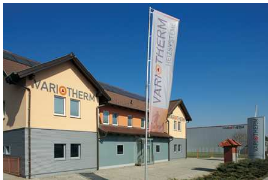
Firmensitz in Leobersdorf

JPGs 300 dpi, bei Bedarf auch EPS vorhanden, bitte als Photocredit © Variotherm anführen