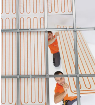
Die Deckenheizung im Trockenbau ist innerhalb weniger Tage montiert