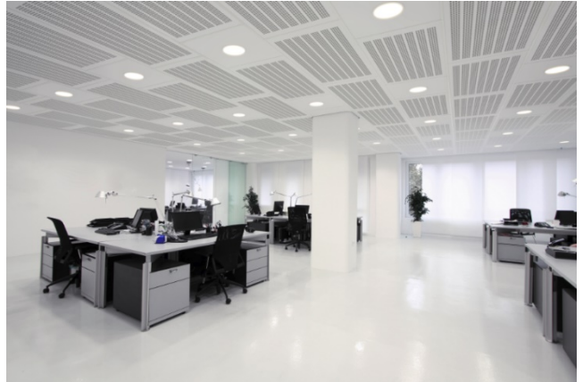
Die Variotherm Modul-Akustikdecke kühlt, heizt und reduziert den Schall

Die Variotherm Modul-Akustikdecke reduziert nicht nur den Schall, sie kühlt und heizt auch den Raum. Somit erfüllt sie drei Anforderungen. Die Deckenkühlung und -heizung wird großflächig verlegt und nutzt die gesamte Fläche als Wärme- und Kühlquelle. So wird der Raum gleichmäßig temperiert. Als Energie-Transportmedium wird warmes oder kühles Wasser mittels einer Wärmepumpe durch die Rohre geleitet. So wird im Winter geheizt und im Sommer gekühlt.