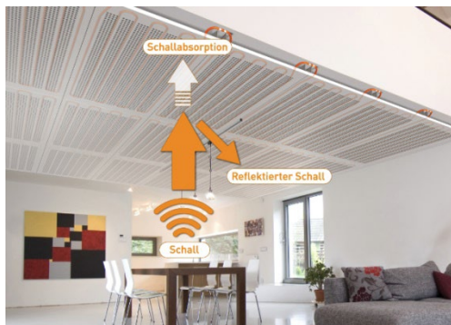
Eine Akustikdecke vermindert die Nachhallzeit

Unser Alltag wird nicht nur schneller, sondern auch lauter. Die Folgen sind Stress und fehlende Konzentration. Genervte Menschen gehen regelrecht an die Decke. Und genau dort liegt die Lösung: Die Akustikdecke von Variotherm schützt den Raum vor Schallbelastung. Zusätzlich kühlt und heizt die Decke die Räume angenehm und gesund. Das bedeutet: eine Decke – drei Funktionen.